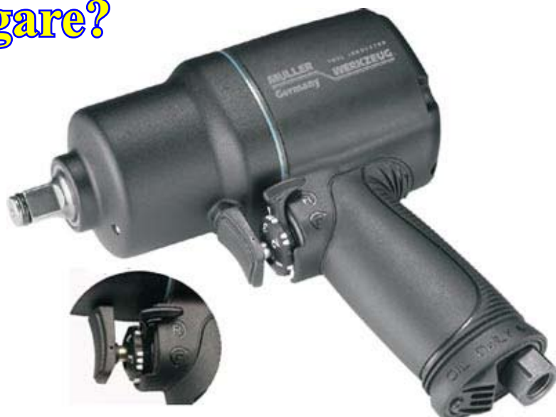
MU-294116 3/8" 680 Nm Vikt 1,08 kg