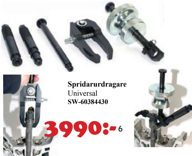
Spridarurdragare Universal SW-60384430