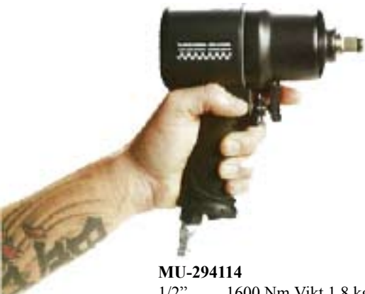
MU-294114 1/2" 1600 Nm Vikt 1,8 kg

Maskinerna är väldigt välbalanserade, lätta och smidiga.